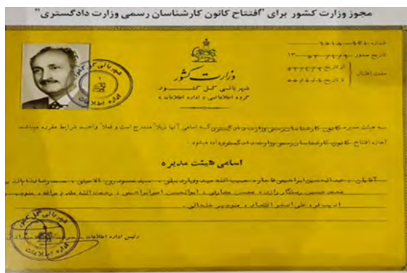
شکل ۲. مجوز وزارت کشور برای افتتاح کانون کارشناسان رسمی وزارت دادگستری

اولین دوره هیئت مدیره کانون کارشناسان رسمی در سال ۱۳۵۲ و دومین دوره آن در سال ۱۳۵۵ تشکیل شد. این کانون صرفاً یک جمعیت صنفی بود که به دادگستری کمک می‌کرد و از نظر سازمانی با وزارت دادگستری ارتباطی نداشت (فامیلی، ۱۴۰۳). تا این زمان، بیشتر افراد تحصیل کرده با مراجعه به کانون پس از گذراندن یک امتحان در اداره‌ی فنی دادگستری به مجموعه کارشناسان می‌پیوستند (بهرامعلی، ۱۴۰۳). کارشناسان ساختمان، علاوه بر رسیدگی به دعاوی پیمانکاران و مردم از طریق دادگستری، به قیمت‌گذاری زمین، ساختمان و سرقفلی و حق کسب و پیشه می‌پرداختند، در حالی که همچنان افراد خیره و معماران سنتی به محاکم رفت‌وآمد داشتند و به قضات مشاوره می‌دادند (شاه‌محمدی، ۱۴۰۳).